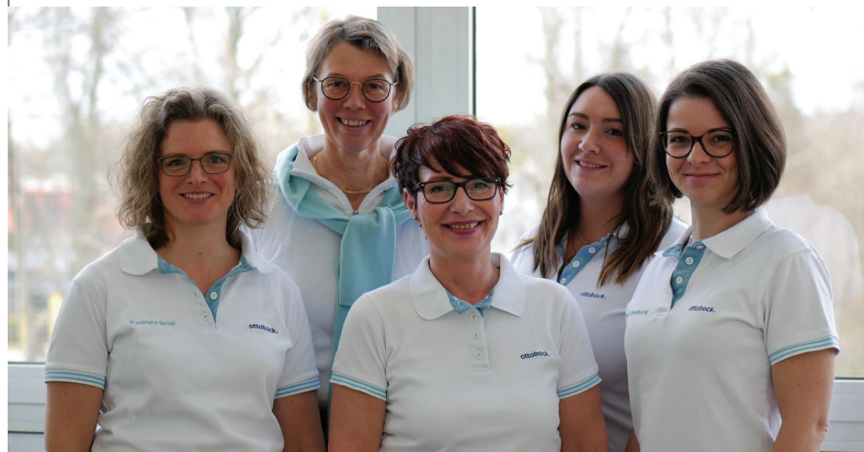
Team Klinik Service

Die Zusammenarbeit zwischen Ärzten und Therapeuten, sowie Ihre Mitarbeit bei der KPE garantieren einen optimalen Therapieverlauf. Lassen Sie sich von Ihrem kompetenten Partner Ottobock beraten.